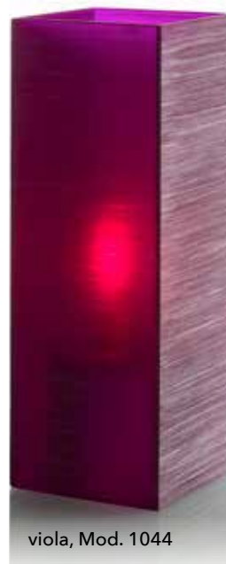
viola, Mod. 1044