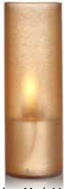
cobre, Mod. 1115