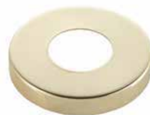
TopDec goldfarbig glänzend Mod.1095, ø 7 cm passend zu Base Gold & Base Style Gold