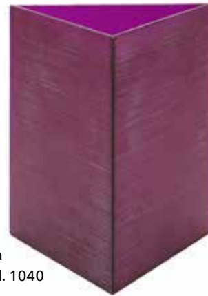
viola Mod. 1040