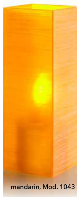
mandarin, Mod. 1043