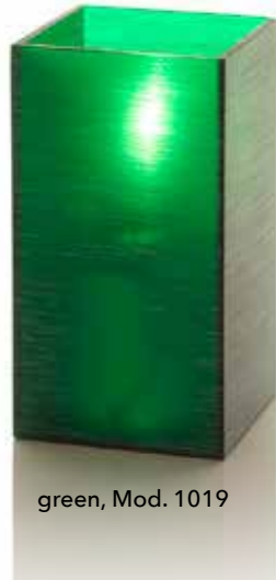
green, Mod. 1019