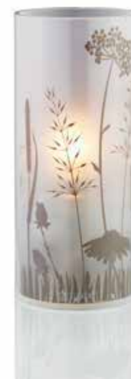
BLOSSOM mit Folieneinlage Farbe ICE . COPPER Mod. 1077