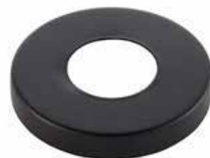
TopDec schwarz Mod.1097, ø 7 cm passend zu Unterteil schwarz