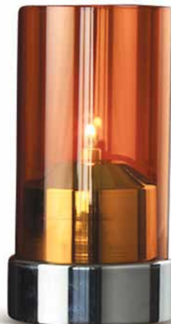
BEACON 3 teilig, Mod. 1083 Farbe AMBER mit Patronenhäube und Unterteil chrom