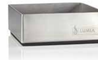
Base PUR | Edelstahl brushed 7 x 7 x 2 cm, Mod. 1087