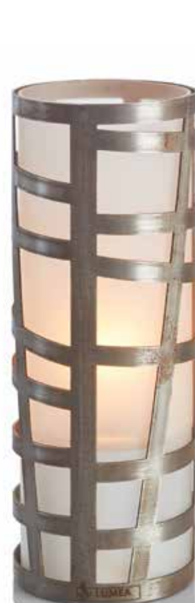
steel Mod. 1106