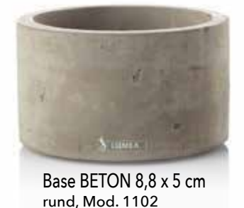
Base BETON 8,8 x 5 cm rund, Mod. 1102