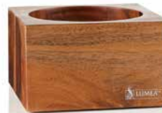
Base WOODY dunkel 8,8 x 8,8 x 5,0 cm eckig Plantagen-Akazie, Mod. 1091