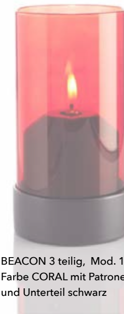
BEACON 3 teilig, Mod. 1O82 Farbe CORAL mit Patronenhaube und Unterteil schwarz

In Verbindung mit unseren 100% reinen LUMEA Pflanzenölkartuschen bieten wir ein extrem sauberes und einfaches Handling.