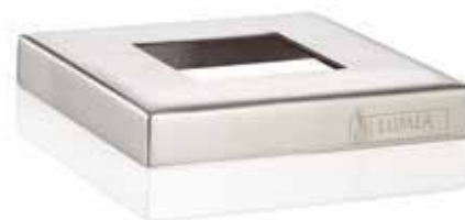
TopDec Edelstahl matt eckig Mod.1099, 7 x 7 cm passend zu Unterteil PUR