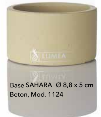
Base SAHARA Ø 8,8 x 5 cm Beton, Mod. 1124