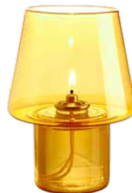
orange Mod. 1702

In Verbindung mit unseren 100% reinen LUMEA Pflanzenölkartuschen bieten wir ein extrem sauberes und einfaches Handling.