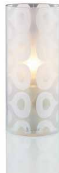
RAGTIME mit Folieneinlage Farbe ICE . ICE Mod. 1075

In Verbindung mit unseren 100% reinen LUMEA Pflanzenölkartuschen bieten wir ein extrem sauberes und einfaches Handling.