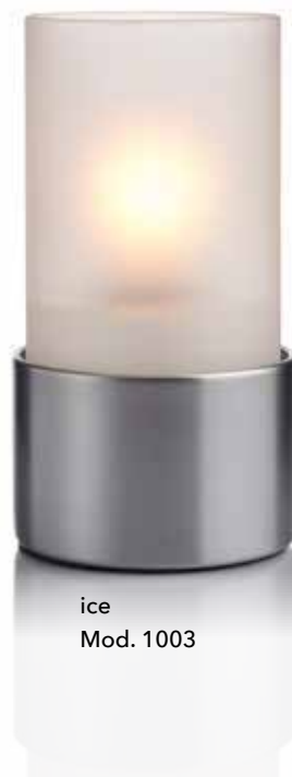
ice Mod. 1003