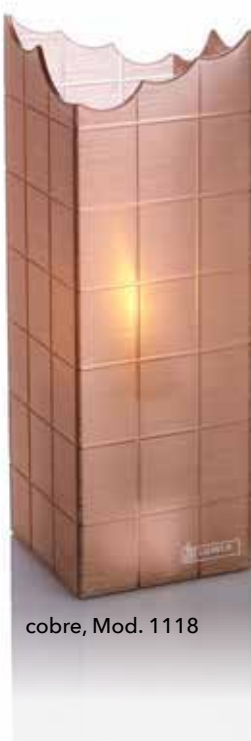
cobre, Mod. 1118