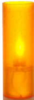
mandarin, Mod. 1045