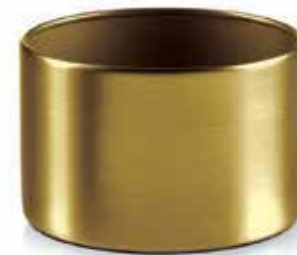
Base GOLD shiny, Mod. 1002