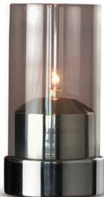
BEACON 3 teilig, Mod. 1081 Farbe GREY mit Patronenhäube und Unterteil chrom