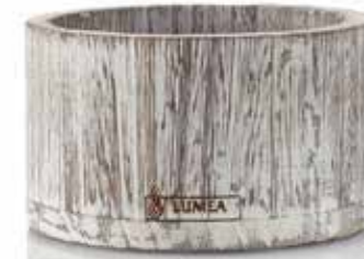
Base BEACH-WEISS | HOLZ, Ø 8,8 cm x 2,0 cm, rund, Mod. 1103