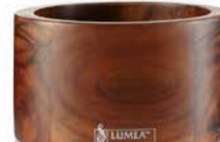
Base WOODY dunkel, Ø 8,8 x 5,0 cm rund, Plantagen-Akazie, Mod. 1089