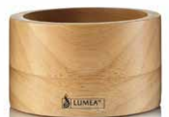
Base WOODY hell, Ø 8,8 x 5,0 cm rund, Plantagen-Rubberwood, Mod. 1088