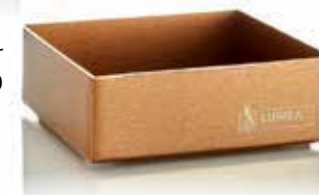
Base SURE | Cobre/Kupfer 7 x 7 x 2 cm, Mod. 1110