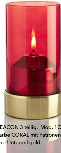
BEACON 3 teilig, Mod. 1O82 Farbe CORAL mit Patronenhaube und Unterteil gold