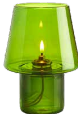
grün Mod. 1701