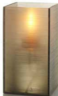
copper, Mod. 1010