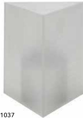
ice Mod. 1037