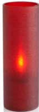
coral, Mod. 1022