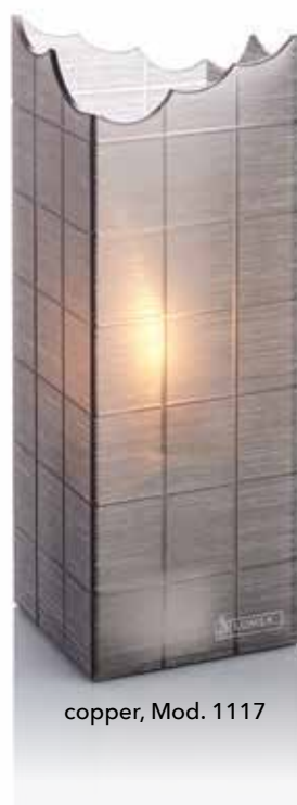
copper, Mod. 1117

In Verbindung mit unseren 100% reinen LUMEA Pflanzenölkartuschen bieten wir ein extrem sauberes und einfaches Handling.