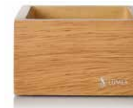
Base TIMBER-hell | Holz 8,5 x 8,5 x 5 cm, Mod. 1093