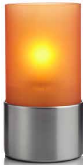
mandarin Mod. 1005