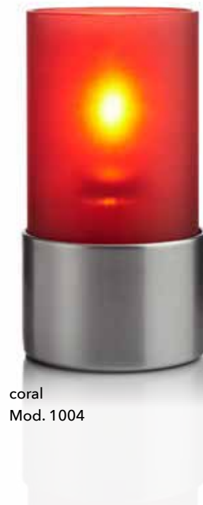
coral Mod. 1004