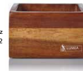
Base TIMBER-dunkel | Holz 8,5 x 8,5 x 5 cm, Mod. 1092