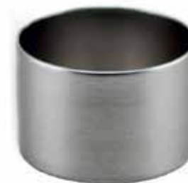
Base SILVER brushed, Mod. 1000