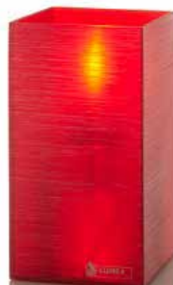
coral, Mod. 1009