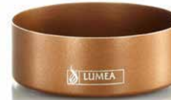
Base TRUE Cobre/Kupfer, Ø 8,8 cm x 2,0 cm, rund, Mod. 1111