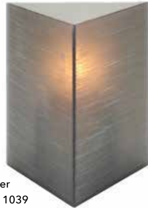
copper Mod. 1039