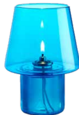
blau Mod. 1700