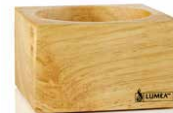
Base WOODY hell, 8,8 x 8,8 x 5,0 cm eckig, Plantagen-Rubberwood, Mod. 1090