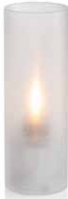
ice, Mod. 1021