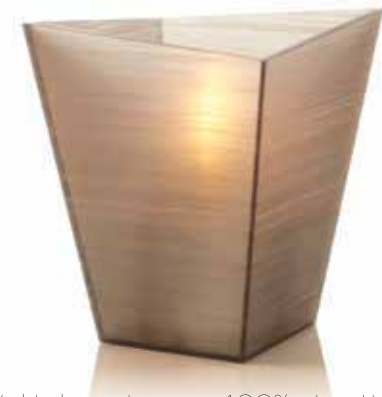
copper Mod. 1063

In Verbindung mit unseren 100% reinen LUMEA Pflanzenölkartuschen bieten wir ein extrem sauberes und einfaches Handling.