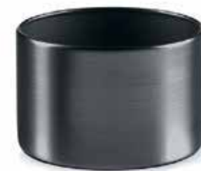
Base BLACK brushed, Mod. 1001

In Verbindung mit unseren 100% reinen LUMEA Pflanzenölkartuschen bieten wir ein extrem sauberes und einfaches Handling.