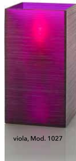
viola, Mod. 1027