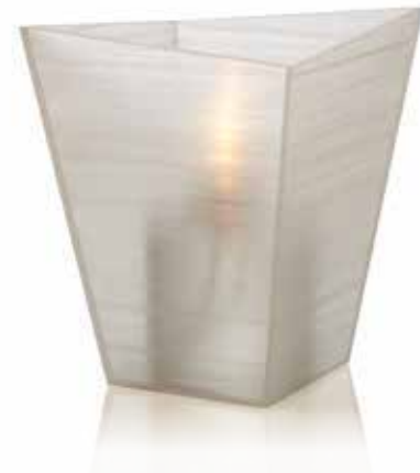
ice Mod. 1064