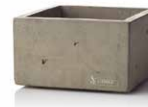
Base BETON | Beton 8,8 x 8,8 x 5 cm, Mod. 1101