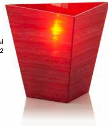
coral Mod. 1062