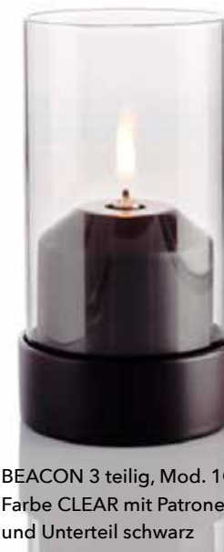
BEACON 3 teilig, Mod. 1O80 Farbe CLEAR mit Patronenhaube und Unterteil schwarz