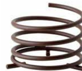
Base SPIRAL rusty, Mod. 1014