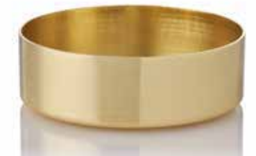
Base STYLE Gold Ø 7,5 x 2,5 cm Mod. 1108