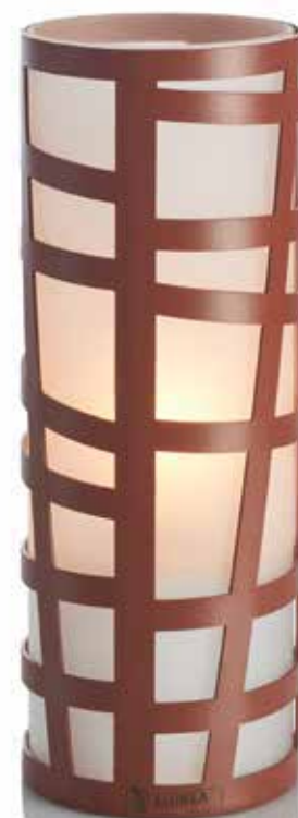
corten Mod. 1105