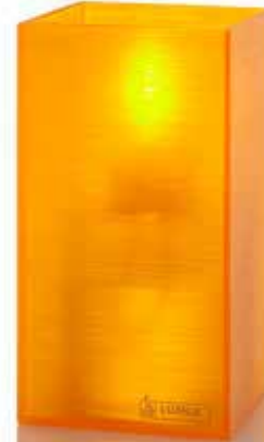
mandarin, Mod. 1028