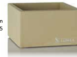
Base SAHARA | Beton 8,8 x 8,8 x 5 cm, Mod. 1125