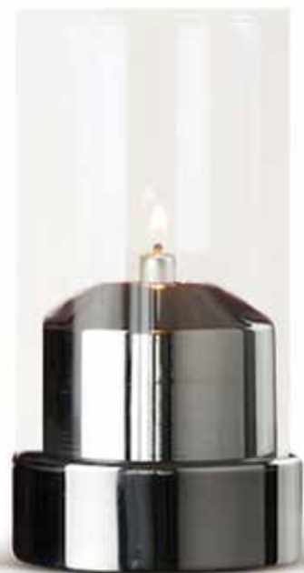
BEACON 3 teilig, Mod. 1080 Farbe CLEAR mit Patronenhäube und Unterteil chrom