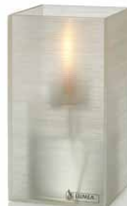
ice, Mod. 1008