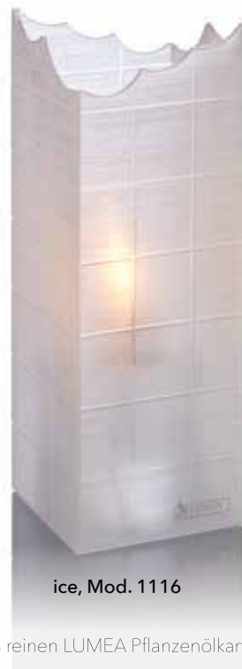
ice, Mod. 1116