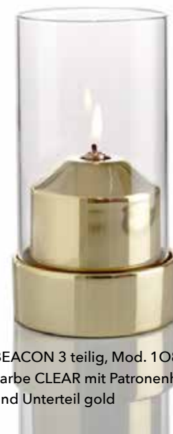
BEACON 3 teilig, Mod. 1O80 Farbe CLEAR mit Patronenhaube und Unterteil gold