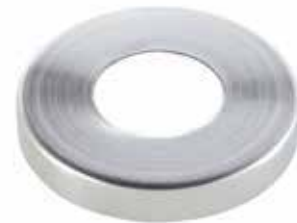
TopDec edelstahl matt rund Mod.1100, ø 7 cm passend zu Unterteil STYLE