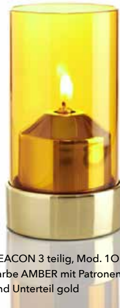
BEACON 3 teilig, Mod. 1O83 Farbe AMBER mit Patronenhaube und Unterteil gold