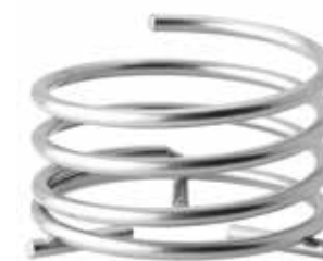
Base SPIRAL silver, Mod. 1013

Weitere Varianten finden Sie auf Seite 9 und 11