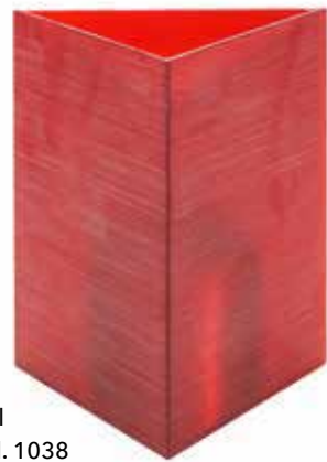
coral Mod. 1038

In Verbindung mit unseren 100% reinen LUMEA Pflanzenölkartuschen bieten wir ein extrem sauberes und einfaches Handling.