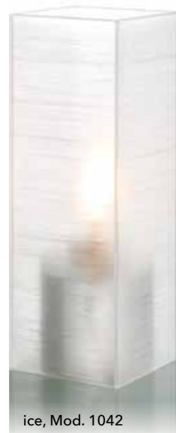
ice, Mod. 1042