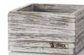
Base BEACH-WEISS | HOLZ 8,5 x 8,5 x 5 cm, Mod. 1104