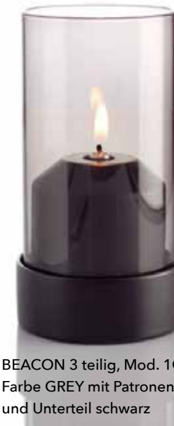
BEACON 3 teilig, Mod. 1O81 Farbe GREY mit Patronenhaube und Unterteil schwarz