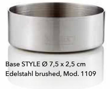
Base STYLE Ø 7,5 x 2,5 cm Edelstahl brushed, Mod. 1109