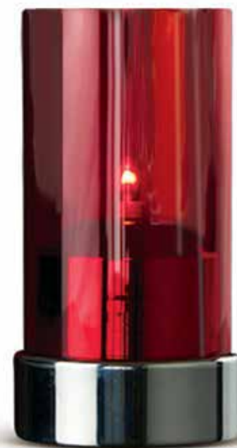
BEACON 3 teilig, Mod. 1082 Farbe CORAL mit Patronenhäube und Unterteil chrom