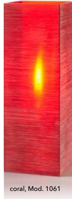
coral, Mod. 1061