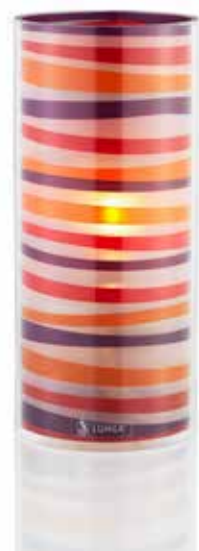
EASY mit Folieneinlage Farbe coral . mandarin . viola Mod . 1076

In Verbindung mit unseren 100% reinen LUMEA Pflanzenölkartuschen bieten wir ein extrem sauberes und einfaches Handling.