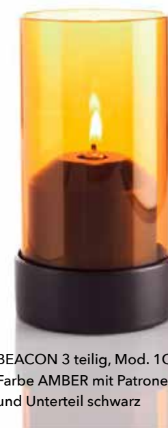
BEACON 3 teilig, Mod. 1O83 Farbe AMBER mit Patronenhaube und Unterteil schwarz