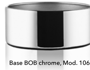
Base BOB chrome, Mod. 1066