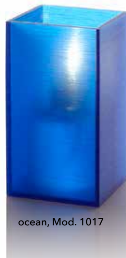
ocean, Mod. 1017