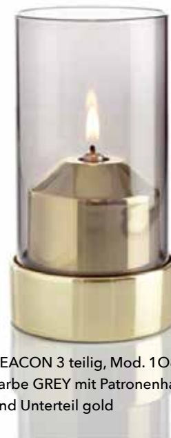
BEACON 3 teilig, Mod. 1O81 Farbe GREY mit Patronenhaube und Unterteil gold