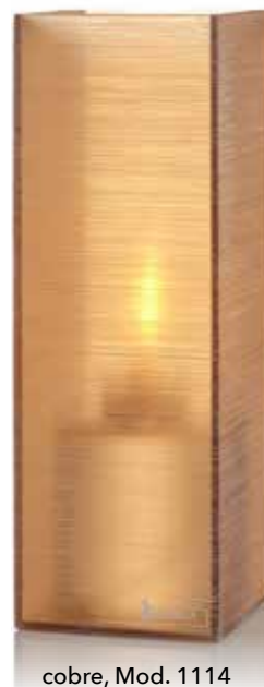
cobre, Mod. 1114