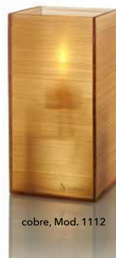
cobre, Mod. 1112